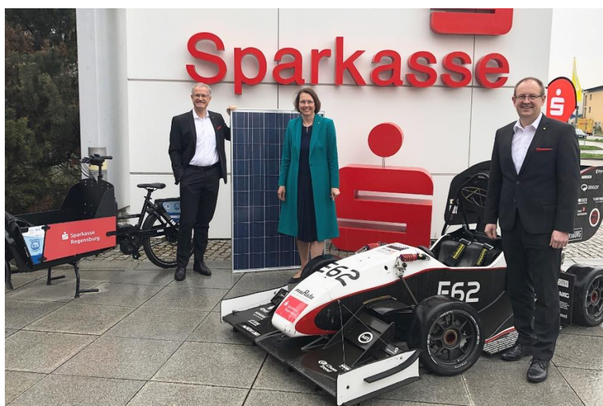
Auf dem Foto: Die Vorstände erläuterten im Rahmen einer Pressekonferenz die Geschäftsergebnisse des letzten Jahres und nahmen darüber hinaus auch eine Einschätzung der aktuellen Lage vor.

Und das hat uns in unserer ureigenen DNA der Sparkasse bestätigt: Hier vor Ort für die Menschen da zu sein“, so die Vorstandsvorsitzende.